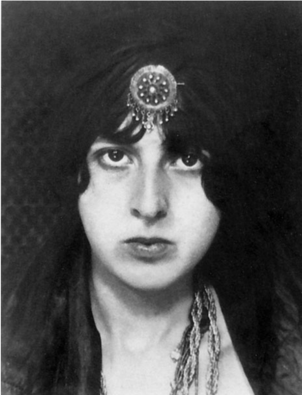
Afb. 23. Claude Cahun , ongetiteld zelfportret , ca 1911, gelatine zilver print, Jersey Heritage Trust Collection.