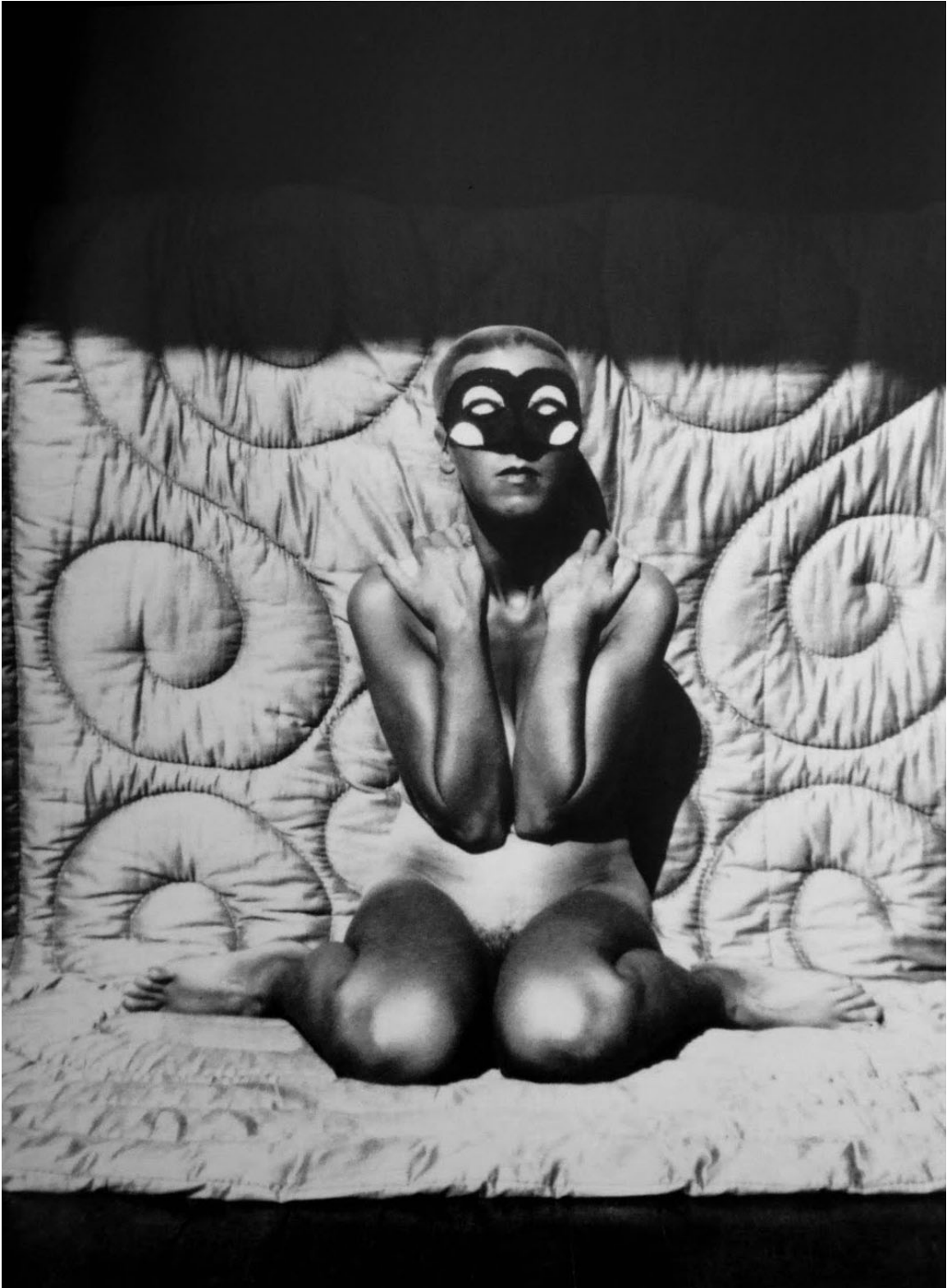
Afb. 30. Claude Cahun, ongetiteld zelfportret , ca 1928, gelatine zilver print, 116 mm x 83 mm, Jersey Heritage Trust Collection.