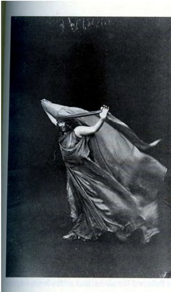
Figure 22. Photograph of Loie Fuller dancing as Salomé (1895). Courtesy of Réunion des Musées Nationaux/Art Resource, New York.

Afb. 29. Salome, gedanst door Loie Fuller, 1895, Réunion des Musées Nationaux/ Art Resource, New York.